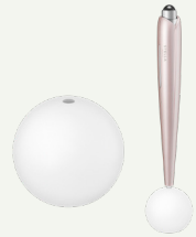
Beauty Face Stick Rin専用 KANZASHIスタンド

かつて誓(かんざし)は、「あなたを守ります」という誓いとともにご贈られていました。その想いに着想を得て、Rinが誓のように見えるスタンドを仕立てました。